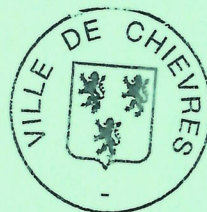
Mme M-L VANWIELENDAELE