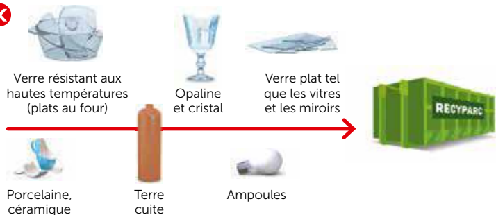
Verre résistant aux hautes températures (plats au four)