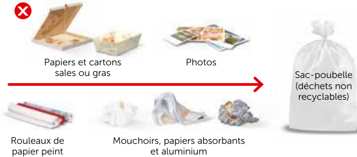
Papiers et cartons sales ou gras