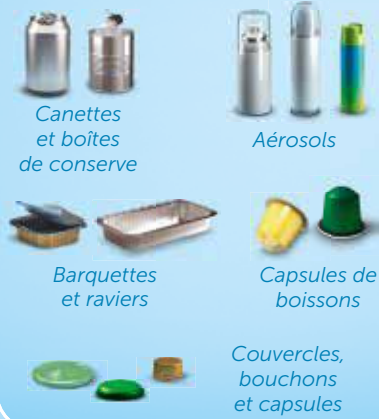
Canettes et boîtes de conserve